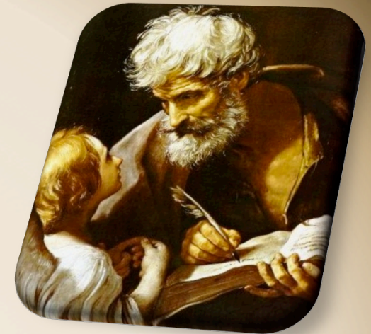
Evangelio según San Mateo

Durante todo el curso, contará con la asesoría técnica de un experto en el manejo del sistema operativo de Internet, para facilitar el acceso a los materiales de trabajo y demás recursos indispensables para el funcionamiento del programa. De igual manera, contará con la asesoría de un tutor en el área de la profundización de temas, a quien podrá consultar con seguridad y confianza.